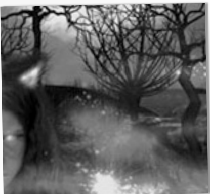
GALERIE VIRTUELLE P.2

Pour plus de détails, consultez le www.aquesap.org section Actualité/ Expo des membres