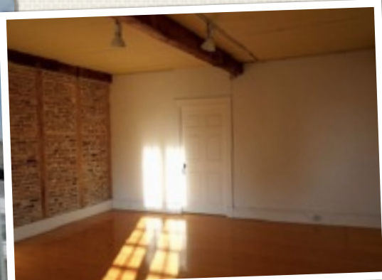
LA GALERIE D'ART DU PARC