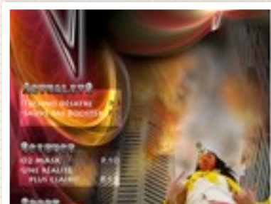
PROJET DE KARINE MARTIN