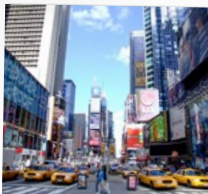
VOYAGE À NEW YORK P.2